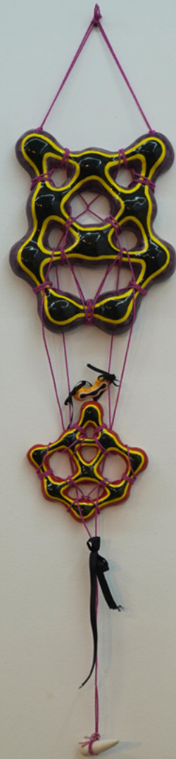
■ Atrapasueños #2 (2022) de Vitch. Cerámica, sogas, cintas de raso. Medidas: altura: 1,40m, ancho: 30cm