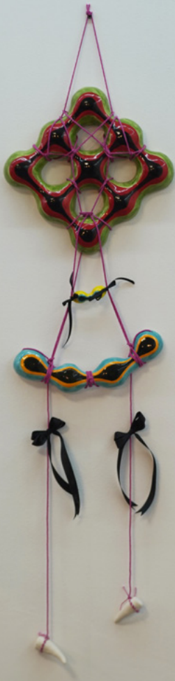
■ Atrapasueños #1 (2022) de Vitch. Cerámica, sogas, cintas de raso. Medidas: 110 x 32 cm