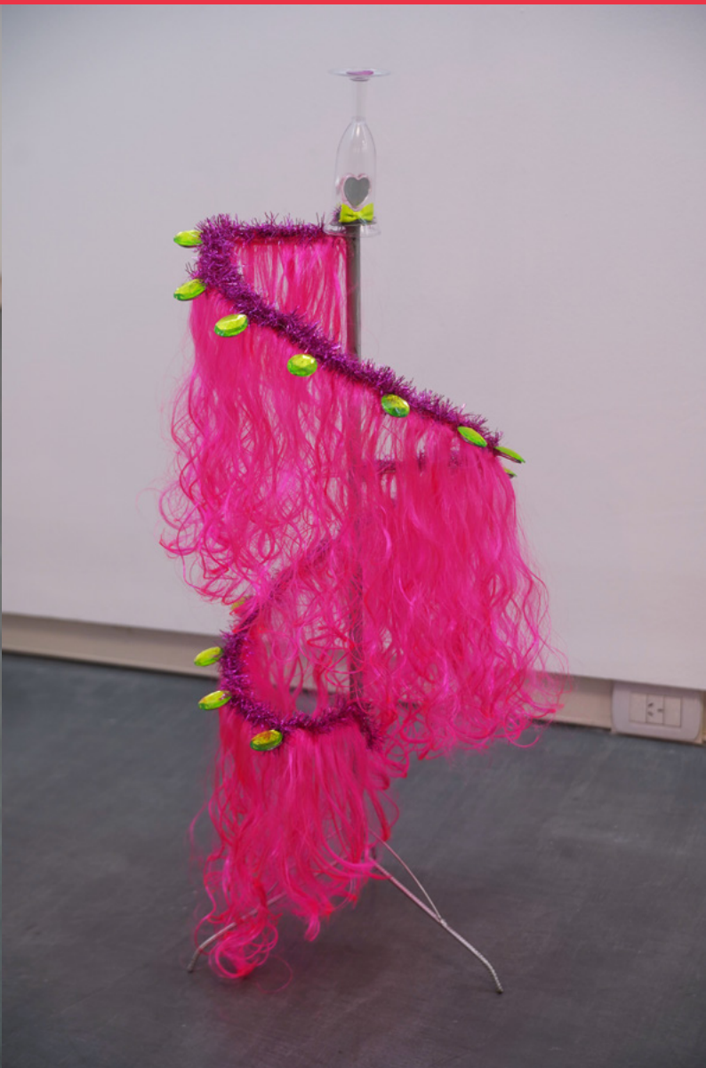
■ Copeteena 2 (2022) de Fantasy Dynasty. Estructura de hierro, pelo sintético, gemas de plástico, copa de plástico. Medidas: 110 cm x 50 cm