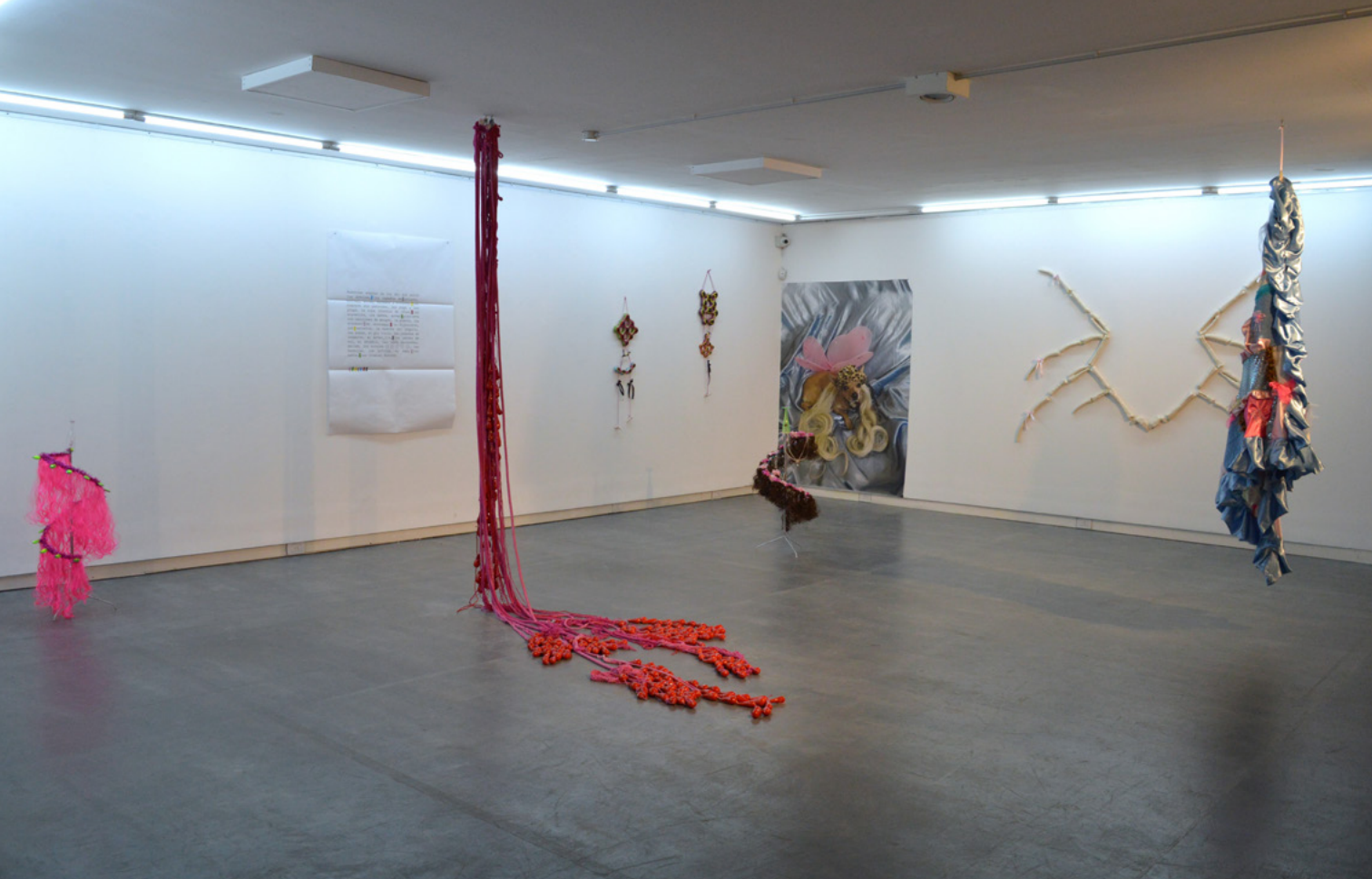
Vista de la sala