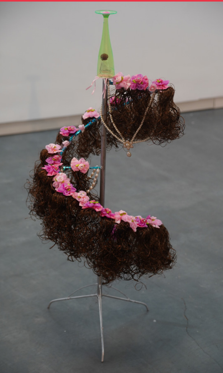
■ Copeteena 1 (2022) de Fantasy Dynasty. Estructura de hierro, pelo sintético, copa de plástico, bijouterie. Medidas: 110 x 50 cm