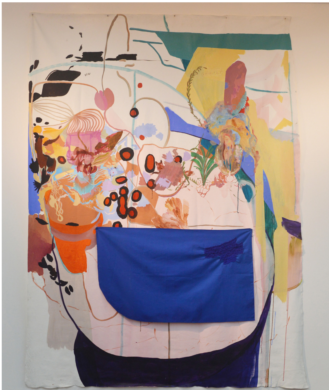
Esperando na janela (2019), Catalina León. Técnica mixta sobre lienzo. 200 x 155 cm