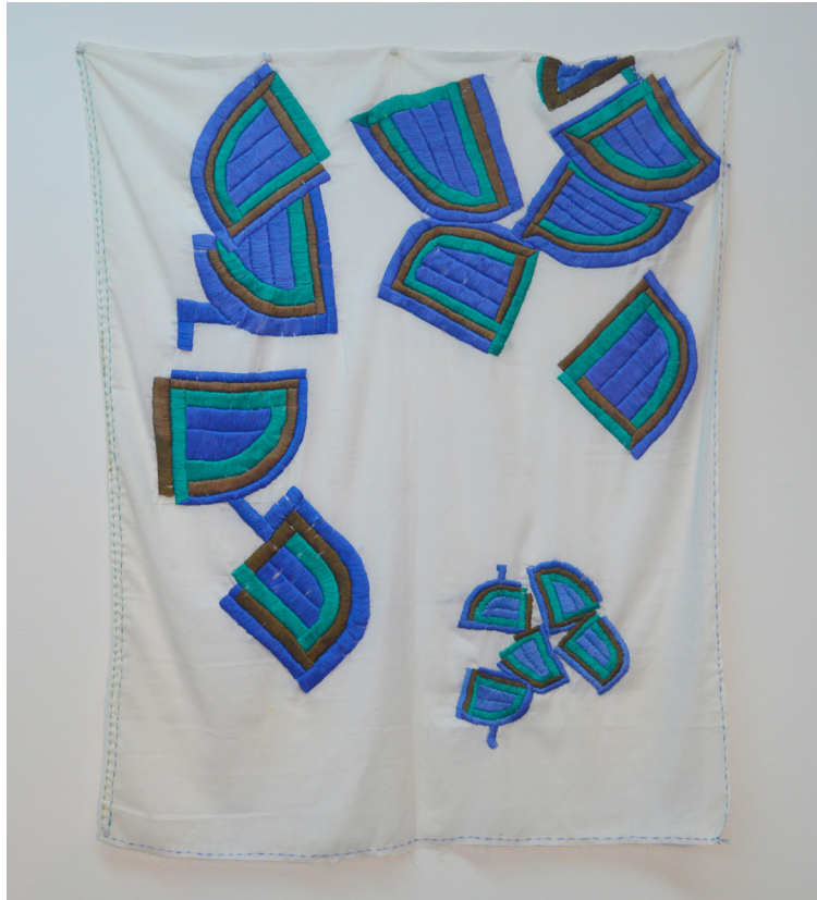
Sin título (2013), Inés Raiteri. Hilo de seda sobre batista de seda. 110 x 100 cm