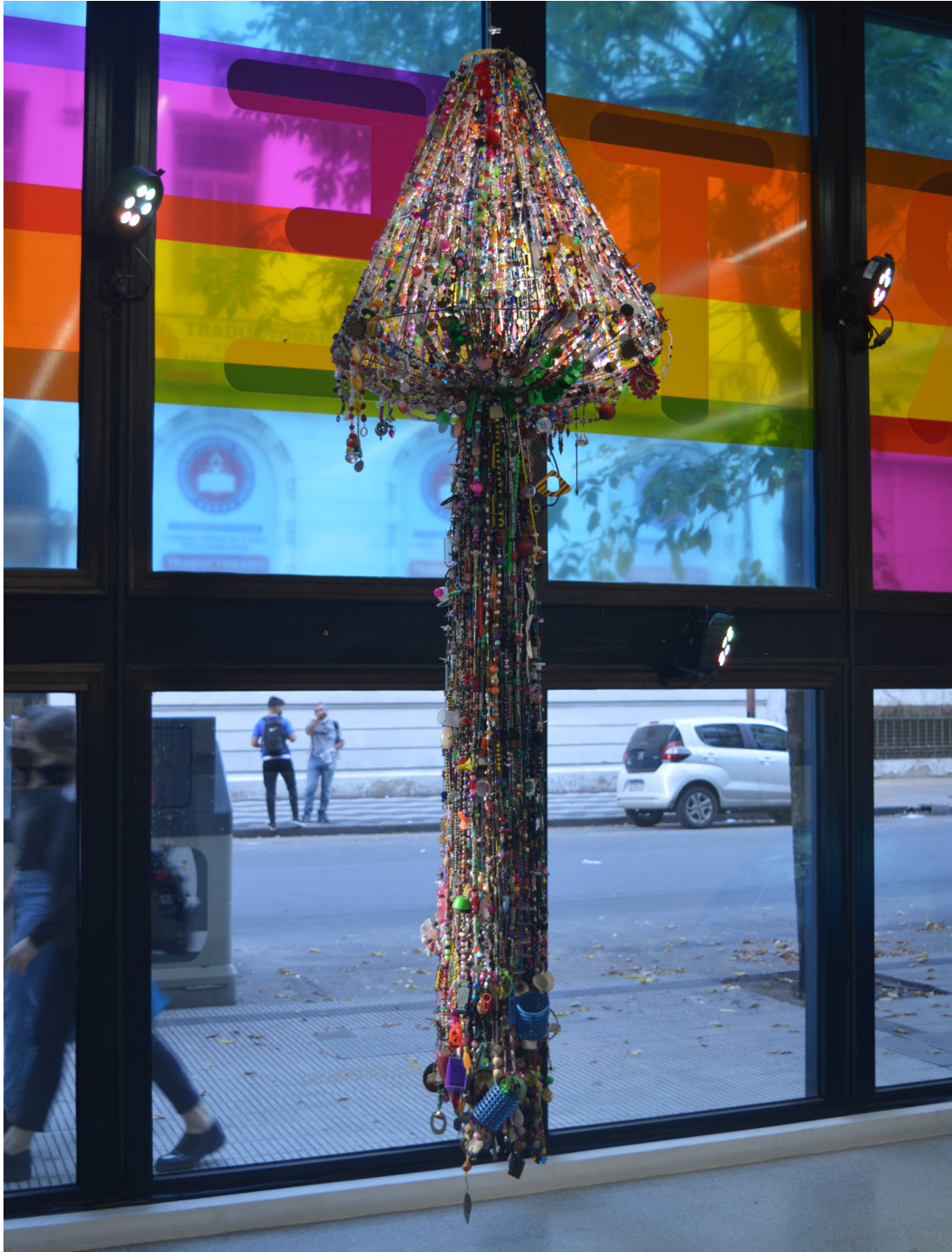
Medusa (2019). Tanza metálica y objetos enhebrados, medidas variables.