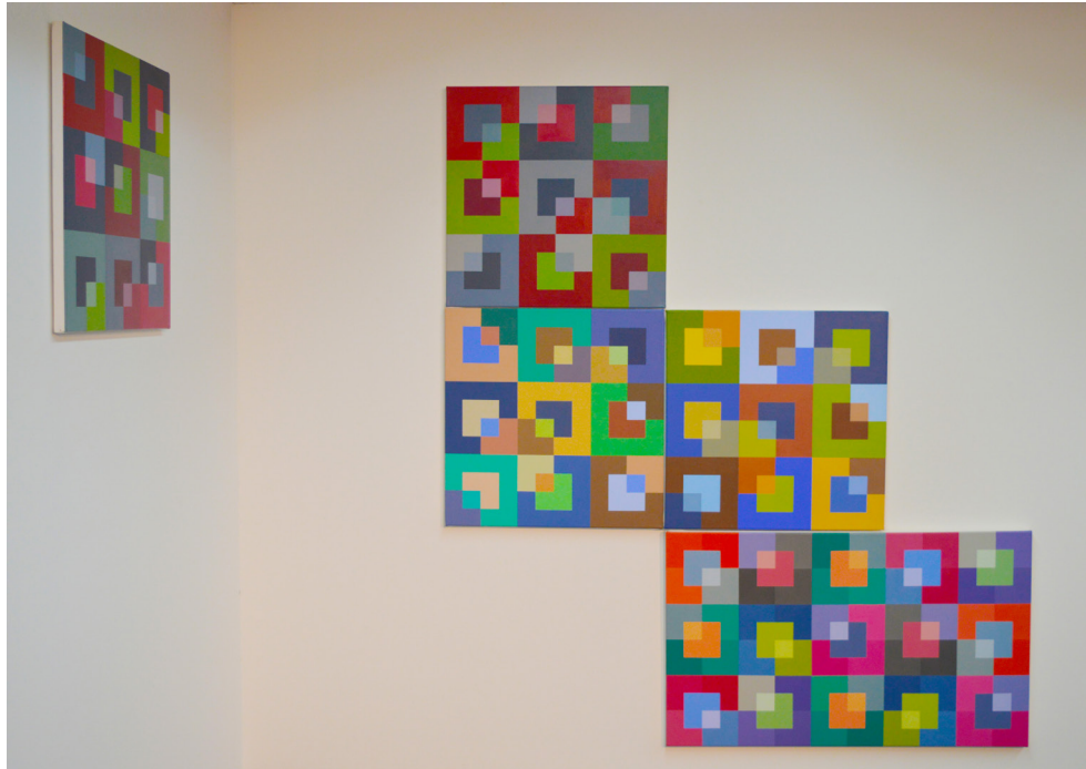
Serie Cuadrículas (2018), Verónica Di Toro. Acrílico sobre tela. 180 x 160 cm