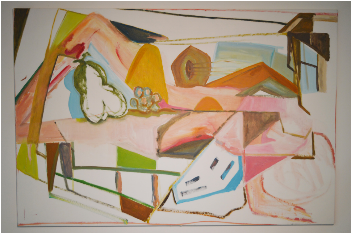
Sin título , de la serie Solarizada (2017), Deborah Pruden. Óleo sobre tela. 118 x 192 cm