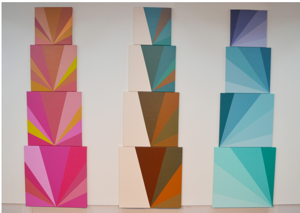
Color timeline III, IV y V. De la tierra al cielo (2016), Carla Bertone. Polípticos compuestos por 5 bastidores cada uno. Acrílico sobre tela. 60 cm x 200 cm