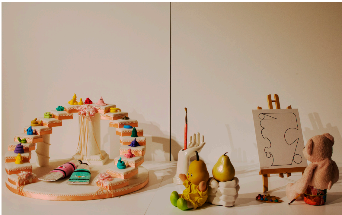
Mesa de trabajo encantada (2019). Objetos encontrados y artesanías en porcelana fría realizadas por Cecilia Armendariz. Medidas variables.