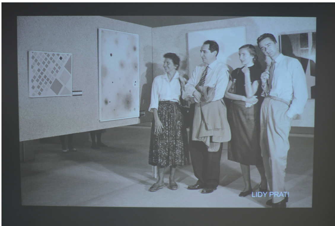
Las promesas (2019), Paola Vega. Video. Duración 9,5 minutos