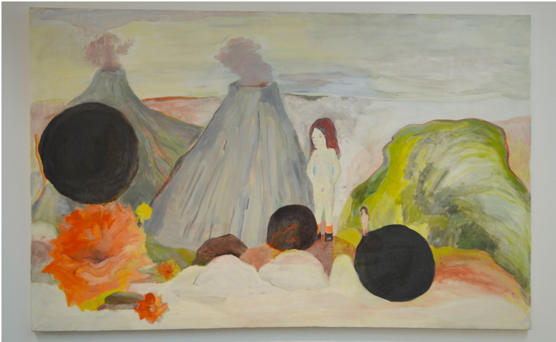
Sin título (2006), Claudia Del Río. Acrílico y óleo sobre tela. 75 x 120 cm.