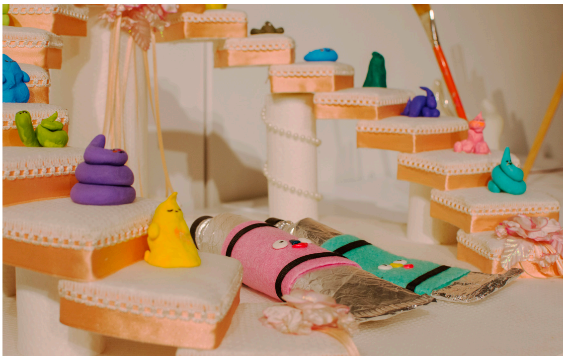
Mesa de trabajo encantada (2019). Detalle