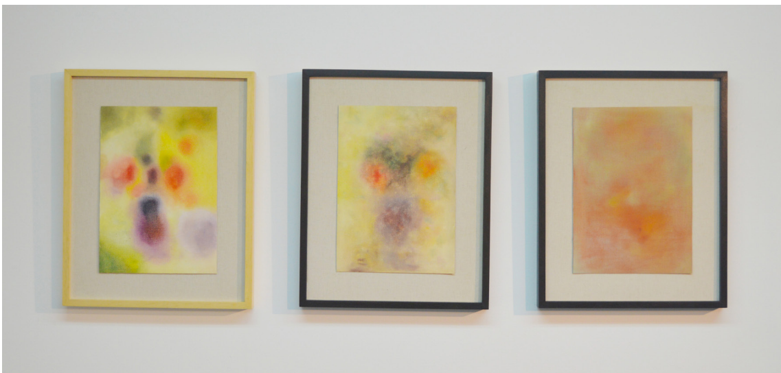
Sin título (2019), Silvia Gurfein. Óleo sobre tela. 50 x 40 cm c/u