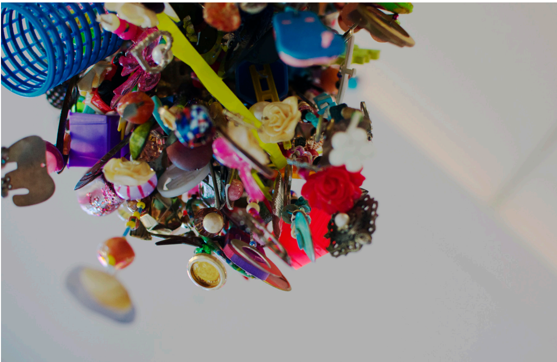
Medusa (2019). Detalle.