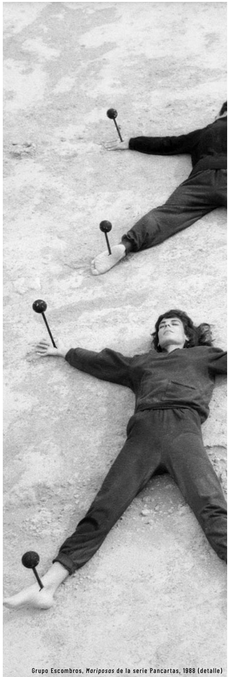
Grupo Escombros, Mariposas de la serie Pancartas , 1988 (detalle)